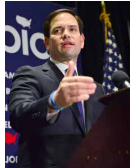
Marco Rubio: halve lieveling van het republikeinse partij-apparaat moest het onderspit delven.