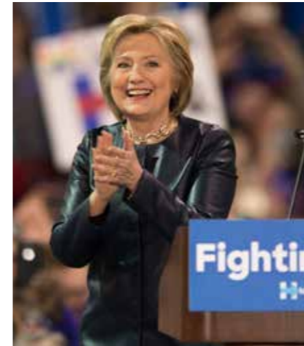
De democratische kandidaat Hillary Clinton: bekwam, maar het prototype van de partijmacht.