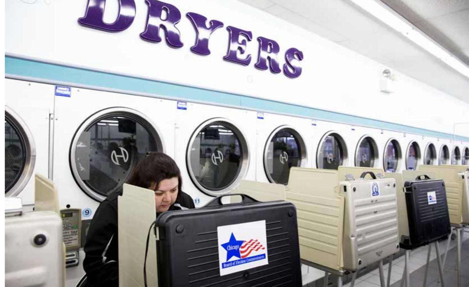
Zoals elke rechtgeaarde burger weet is democratie meer dan het aanvinken van een bolletje in een stemlokaal.

de andere kandidaten. Dit spelletje van eliminatie en herverdeling van tweede keuzes blijft doorgaan tot één van de overblijvende kandidaten de absolute meerderheid haalt. Door reeds bij de eerste stemming je voorkeurslijst op te stellen wordt vermeden dat kiezers verschillende keren naar de stembus moeten trekken en wordt meteen een virtuele tweede, derde of vierde ronde georganiseerd.