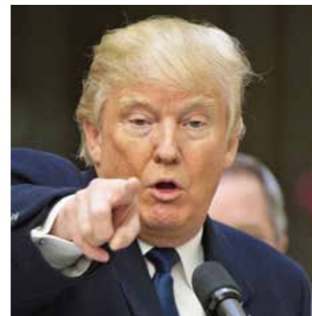
Meer dan tweederden van het republikeinse kiespubliek heeft in opiniepeilingen aangegeven dat zij nooit zullen stemmen voor “the Donald”.

Alternative voting of preferentieel stemmen houdt in dat de kiezers in de eerste en enige ronde de kandidaten moeten ordenen volgens hun voorkeur. Tot zolang niemand van de kandidaten meer dan 50% van de stemmen behaalt op basis van de eerste voorkeur van de kiezers wordt telkens de kandidaat met de laagste score geëlimineerd. Vervolgens wordt de “tweede keuze” van de kiezers van de geëlimineerde kandidaat opgeteld bij de resultaten van de “eerste voorkeur” van