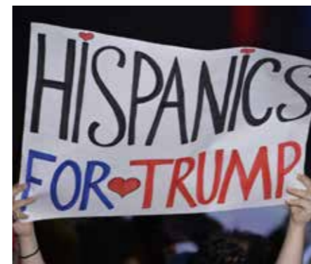
Een voordeel voor Donald Trump? De verkiezingen van 2016 hebben voor het eerst betrekking op een electoraat dat voor bijna een derde bestaat uit minderheidsgroepen.

met de dictaten van de partij en komen massaal opdagen in de primaries om te stemmen voor de anti-partijestablishment figuur. Tevens is het succes van Trump te relateren met zijn 'out of the box'-campagne en het feit dat hij zijn campagne zelf financiert. Al de andere kandidaten zijn afhankelijk van donaties en diens voorwaarden. Trump heeft ook belangrijke 'endorsement' gekregen met o.a. de steun van de gematigde gouverneur van de staat New Jersey: Chris Christie (1962, katholiek), de gewezen kandidaat dr. Ben Carson (1951, adventist) etc. Met Trump komt er opnieuw een traditioneel republikeins thema naar voren: economisch protectionisme (bijv. invoer staal) en een minder actief optreden in het buitenland. Als niet-kandidaat van de partij gelijkt hij op Reagan in 1980, die uiteindelijk de partijman Bush meenam als running mate.