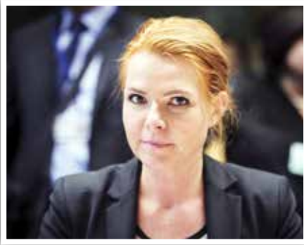
Inger Støjberg, minister van Binnenlandse Zaken in Denemarken: wie de wetten overtreedt en met minderjarigen seksuele contacten heeft, wordt het land uitgezet, of mag niet meer binnen.

terseliesaus gekozen tot hét nationale gerecht van het land. Dat afvoeren voor een minderheid onwillige islamieten schoot de Denen in het verkeerde keelgat, vooral toen enkele imams inderhaast de Denen van racisme en discriminatie beschuldigden. Ze verwarden even de rol van gast en gastheer, zo blijkt. In het industriestadje Randers namen ze dat op hun krachten. “Wie geen varken lust, moet het maar bij groenten houden”, luidde het, en de scholen weigerden nog, zoals in het Franse Chalon-sur-Saône, een andere maaltijd te voorzien voor joden en islamieten.