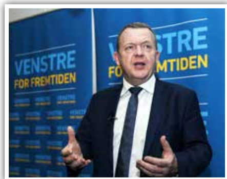
Lars Løkke Rasmussen van de liberale partij Venstre: met handen en voeten gebonden aan de inschikkelijkheid van de Volkspartij.

Natuurlijk spelen ernstige binnenlandse uitdagingen mee. De Denen zijn niet langer geïnd met de lankmoedigheid die in het verle-