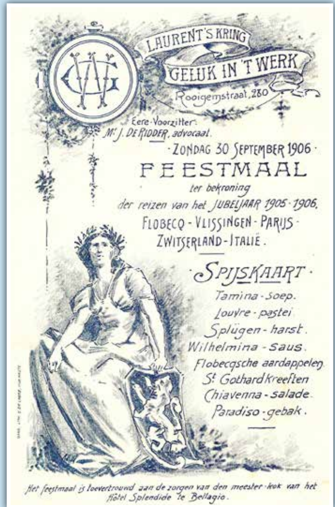
Menu ingeplakt in het verslagboek van de Gentse Laurentkring Geluk in 't Werk.